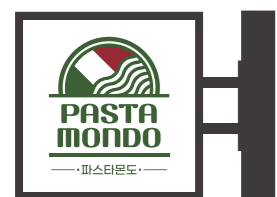
사각형 돌출간판 (Color Type A)